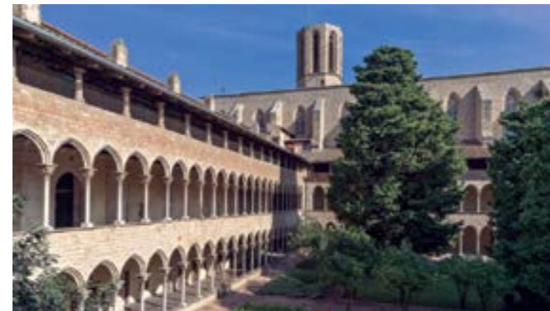
El claustre, amb el campanar al fons