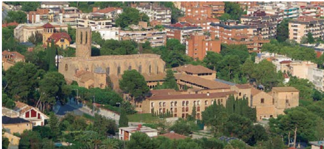
Vista aèria del conjunt monàstic de Pedralbes (Barcelona). En el primer terme hi ha el convent nou de les monges. El van estrenar l'any 1983

E l 15 de febrer de l'any 2025 la comunitat de clarisses de Pedralbes va ser notícia perquè les tres darreres religioses que hi restaven se'n van anar a la fraternitat del mateix orde, a Vilobí d'Onyar (La Selva), per manca de vocacions i de relleu generacional.