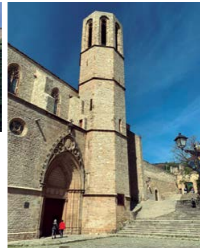
Campanar, portalada i part de la façana de l'església